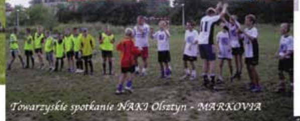
Towarzyskie spotkanie NAKI Olsztyn - MARKOVIA