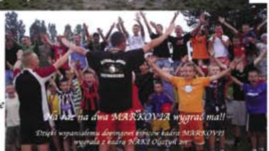
Na niebie dwa MARKOVIA wygrali ma! Dzięki wspaniałemu dopingowi kibiców kadra MARKOVIA wygrała z kadra NAKI Olsztyn 3:0

UWAGA! Spotkanie wszystkich obozowiczów na III Spartakiadzie CZAT MARKI 2007 23.09.07 Stadion Marcovii