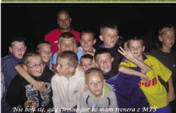
Nie boj się, gdy ciemno jest bo mam trenera z MTS

UWAGA! Spotkanie wszystkich obozowiczów na III Spartakiadzie CZAT MARKI 2007 23.09.07 Stadion Marcovii