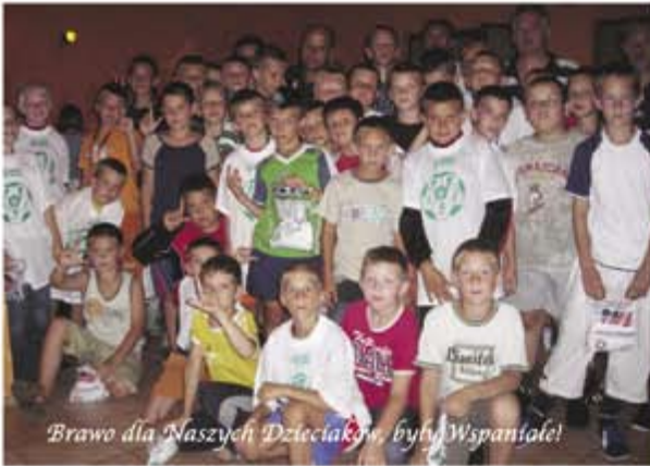
Brawo dla Naszych Dzieciaków, byli Wspaniałe!