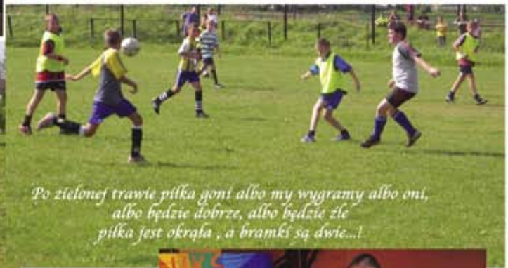
Po zielonej trawie piłka goni albo my wygramy albo oni, albo będzie dobrze, albo będzie źle, piłka jest okrągła, a bramki są dwie...!

Tak wypoczywały dzieci na obozie szkoleniowo-sportowym zorganizowanym przez UKS MARKI i MTS MARKOVIA 2000 w miejscowości Junoszyno-Jantar w sierpniu 2007. Obraz przekazuje bardziej atmosferę niż słowa dlatego prezentujemy Państwu krótki fotoreportaż.