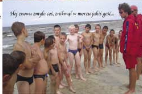
Hej znowu zmyło coś, zniknął w morzu jakiś gość...

Tak wypoczywały dzieci na obozie szkoleniowo-sportowym zorganizowanym przez UKS MARKI i MTS MARKOVIA 2000 w miejscowości Junoszyno-Jantar w sierpniu 2007. Obraz przekazuje bardziej atmosferę niż słowa dlatego prezentujemy Państwu krótki fotoreportaż.