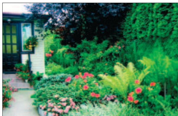
I Miejsce - posesja przy ul. Dmowskiego 25.