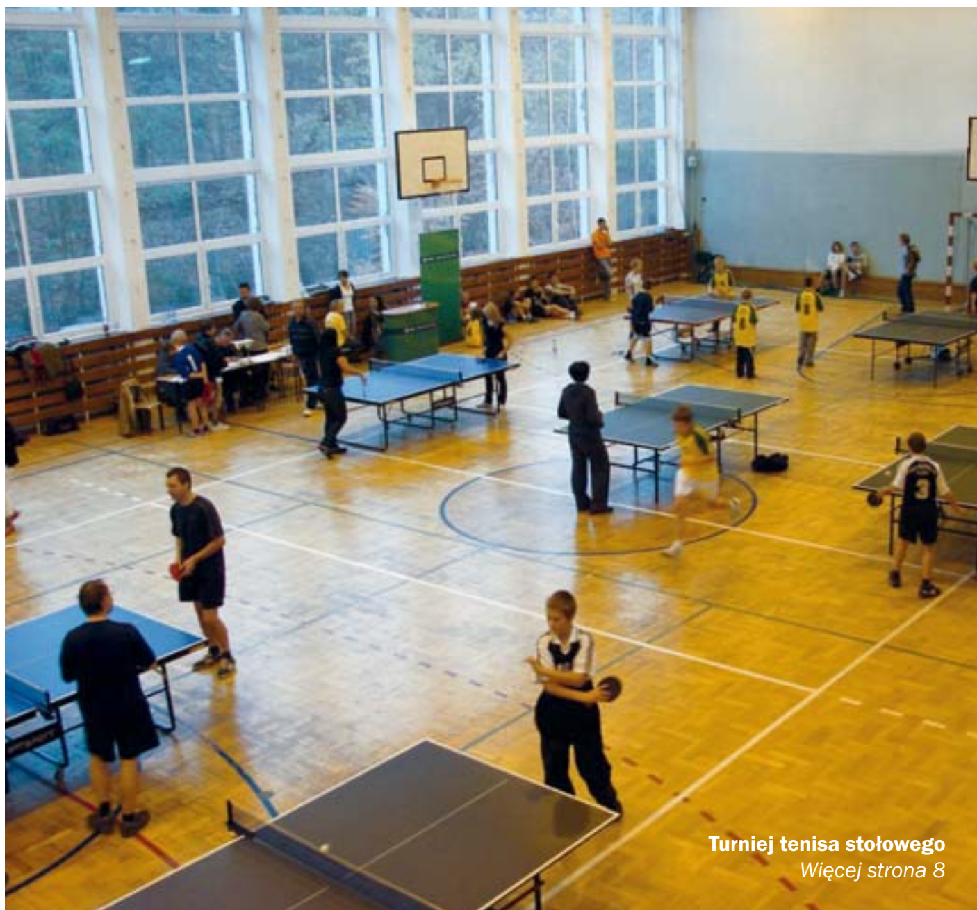
Turniej tenisa stołowego Więcej strona 8

- 85 lat minęło (Marcovii) – str. 5; - Fotoreportaż ze Spartakiady – str. 6-7; - 11 Listopada - Święto Niepodległości – str. 9