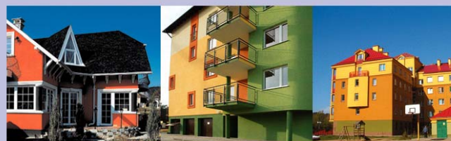
Elewacje wykonane w systemie Terranova

Firma specjalizuje się w handlu detalicznym i hurtowym materiałami budowlanymi.