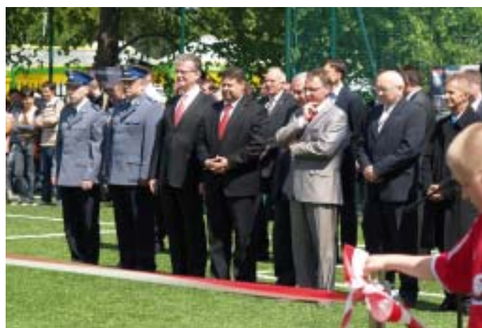
Uroczyste otwarcie boiska w Zielonce.