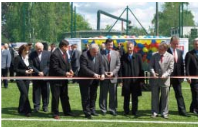
Uroczyste otwarcie boiska w Zielonce.

„W Zielonce na terenie Zespołu Szkół im. Ignacego Mościckiego udostępniono do użytku kompleks wielofunkcyjnych boisk sportowych budowanych w ramach rządowego programu „Orlik 2012 – Moje boisko”. Otwarcie odbyło się w samo południe 14 maja 2009 r. przy udziale władz powiatowych oraz wojewódzkich” – czytamy na stronie internetowej starostwa. Kiedy podobną informację przeczytamy o Markach?