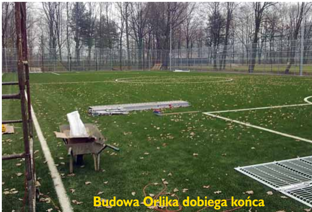
Budowa Orlika dobiega końca