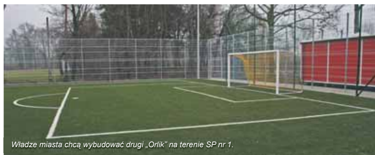
Władze miasta chcą wybudować drugi „Orlik” na terenie SP nr 1.

Koncepcja przewiduje wybudowanie nowoczesnego boiska usytuowanego wzdłuż ul. 11-go Listopada. Kolejne, dwa wielofunkcyjne boiska powstaną w centralnym miejscu nowo zagospodarowanego terenu. Na boisku będzie można rozgrywać mecze siatkówki, koszykówki oraz piłki ręcznej. Radni zadbalali, by na nowym obiekcie znalazła się również 60 metrowa bieżnia, przebieralnia, parking na 2 autokary, odnowiony skate park. Po zakończeniu inwestycji pojawi się również możliwość ulokowania na nowych obiektach lodowiska. (Obecnie takie lodowisko przy ul. Stawowej cieszy się ogromną po-