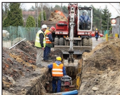
114 mln dla Marek