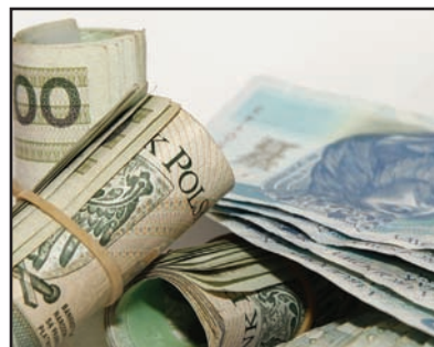
Budżet miasta na 2012 rok