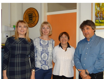
spotkanie z dyrektorem szkoły

W czasie spotkania z uczniami i nauczycielami szkoły pokazaliśmy prezentacje Power Point przygotowane przez naszych uczniów i nauczyciel i- o szkole, Markach, Mazowszu i Polsce a także prezentację o polskim systemie edukacji. Uczniowie węgierscy najwięcej pytań mieli o różne działania dodatkowe- takie jak mam talent, konkurs recytatorski, czy dodatkowe zajęcia sportowe wyrażając chęć przyjazdu do nas i wzięcia udziału w tych zajęciach.