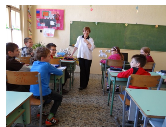
po angielsku o Polsce

Z finansów projektu dokupiliśmy 5 tabletów tak, aby w klasie 24 osobowej była możliwa praca w parach z wykorzystaniem 12 tabletów.