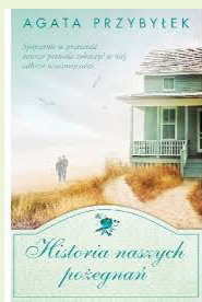
AGATA PRZYBYŁEK „Historia naszych pożegnań”