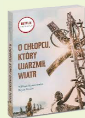
WILLIAM KAMKWAMBA BRYAN MEALER „O chłopcu, który ujarzmił wiatr”