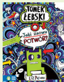
TOMEK LEBSKI „Jaki znowu potwór?”