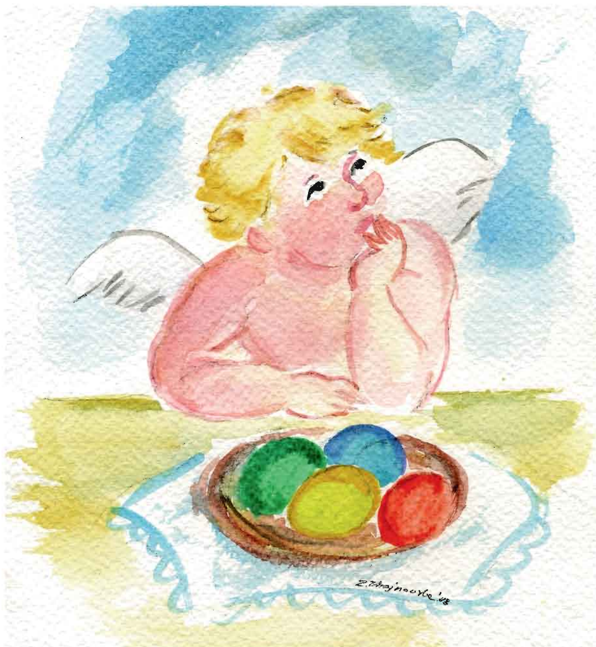
akwarela - Zofia Chojnowska