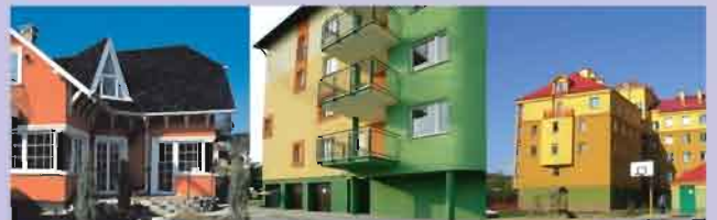
Elewacje wykonane w systemie Teranova

Firma specjalizuje się w handlu detalicznym i hurtowym materiałami budowlanymi.