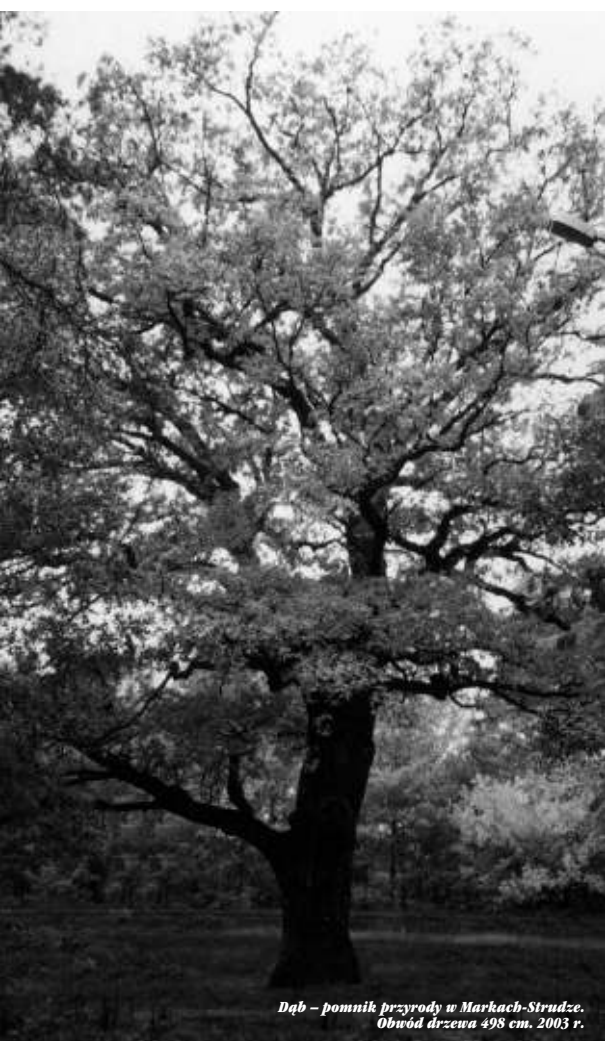
Dąb – pomnik przyrody w Markach-Stradze. Obwód drzewa 498 cm. 2003 r.

nictwie. Świeże liście dębu goją trudno zablźniające się rany. W celach leczniczych zbiera się korę i żołądź. Dojrzałe żołądź, gdy już wypadają z miseczki, suszy się, uwalnia z łupiny i praży. Po zmieleniu wysuszonych żołądź otrzymuje się „kawę zbożową”, a po dodaniu odpowiedniej ilości kakao i cukru – „kakao żołądźowe”. Napoje te skutecznie hamują biegunkę i wzmacniają organizm. Wysuszona kora dębu jest stosowana przeciw ostrym biegunkom i nieżytom żołądkowo-jelitowym. Sporządza się wywar z 1. łyżeczki sproszkowanej kory młodego dębu i szklanki wody i pije 2-3 razy dziennie. Wywar ten stosuje się także zewnętrznie do kąpieli w przypadku odmrożeń i oparzeń skóry, ma zastosowanie w leczeniu grzybic. Jest skuteczny w przypadku nadmiernej potliwości nóg. Galasy – to wyrosła patologiczne na liściach dębu, które powstają w wyniku nakłucia tkanek liścia przez owady z rodziny galasówkowatych. Galasy stanowią surowiec do wyrobu czystej taniny mającej szerokie zastosowanie w terapii, szczególnie do hamowania krwawień, płukania gardła, do wyrobu maści i innych specyfików.