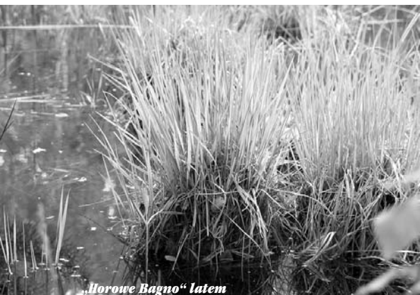
„Horowe Bagno“ latem

Walory przyrodnicze nie zmieniły się od momentu powołania rezerwatu. Obszar rezerwatu jest znacznie zróżnicowany siedliskowo, co sprawia, że występują tu znaczne ilości zbiorowisk roślinnych – mszary wysokotorfowiskowe i przejściowe, jeziorka