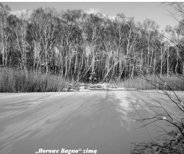
„Horowe Bagno” zimą

Wrażliwość na piękno przyrody stała się inspiracją twórczości literackiej uczniów Szkoły Podstawowej nr 4 w Markach. Niektórzy z nich wzięli udział w Wojewódzkim Konkursie na tomik poezji o tematyce przyrodniczej. Zajęli najwyższe lokaty: