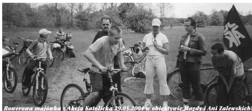
Rowerowa majówka z Akcją Katolicką 29.05.2004

IX. Ogólnopolska Pielgrzymka Akcji Katolickiej na Jasną Górę – 19.06.2004. Zgłoszenia przyjmują członkowie zarządu POAK.