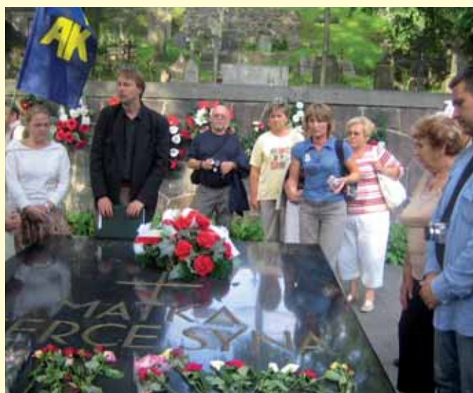
Pielgrzymka POAK do Ostrej Bramy: cmentarz na Rossie w Wilnie, grób matki i serca Marszałka J. Piłsudskiego, 28 VII 2007