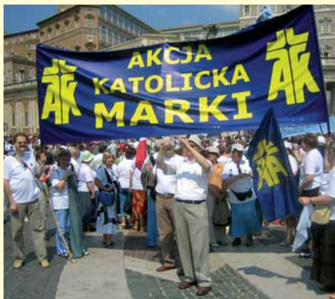
Pielgrzymka POAK do grobu Sługi Bożego Jana Pawła II, 29 IV 2007