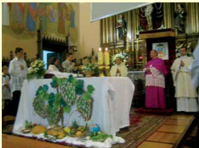
Wizytacja Kanoniczna Biskupa Warszawsko-Praskiego, Abp Sławoja- Leszka Głódzia, 20 V 2007