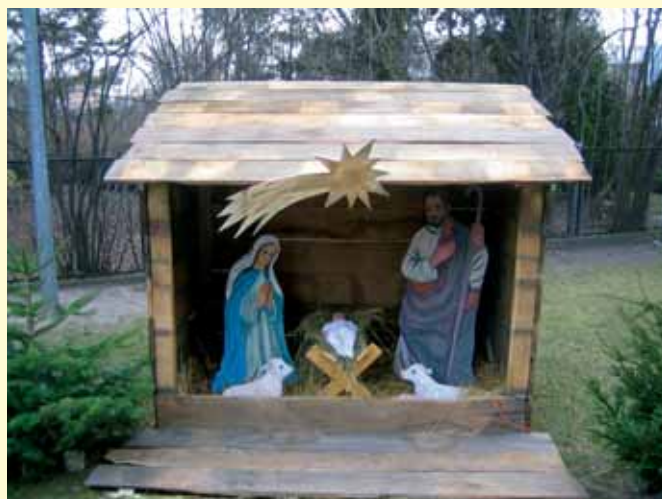
Stajenka betlejemska, 2006