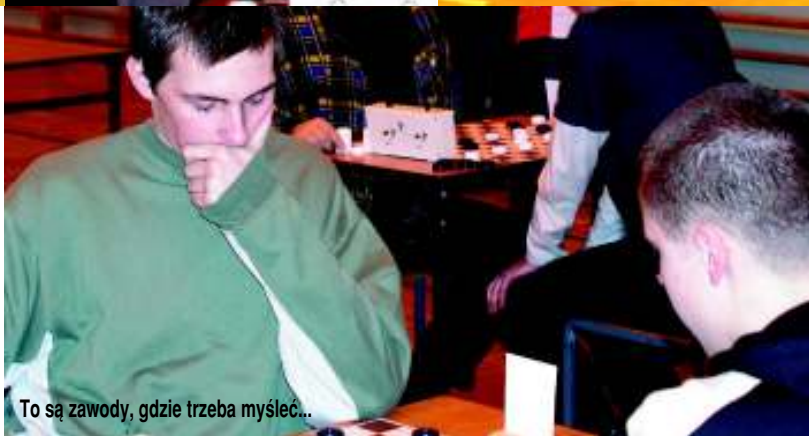
To są zawody, gdzie trzeba myśleć...