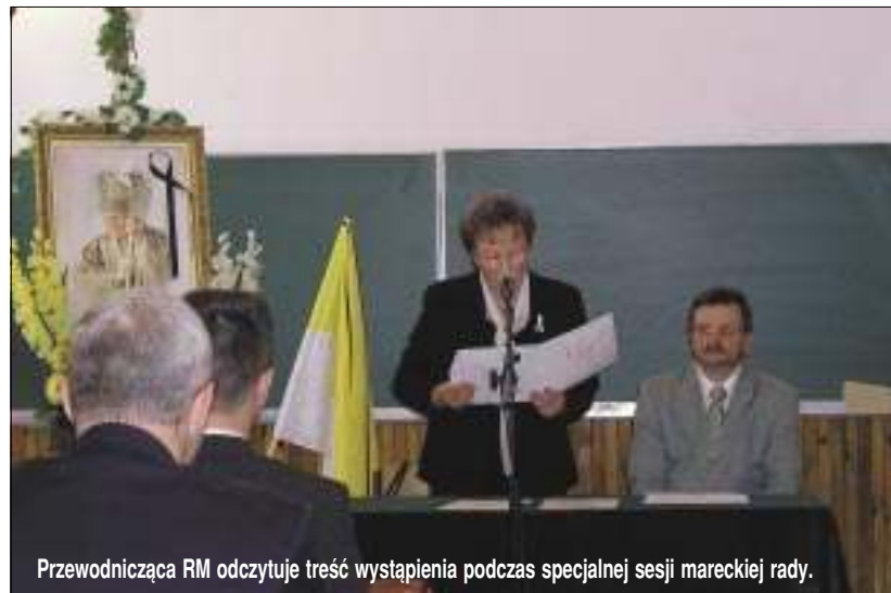
Przewodnicząca RIM odczytuje treść wystąpienia podczas specjalnej sesji mareckiej rady.

pozostawione nam i przyszłym pokoleniom.