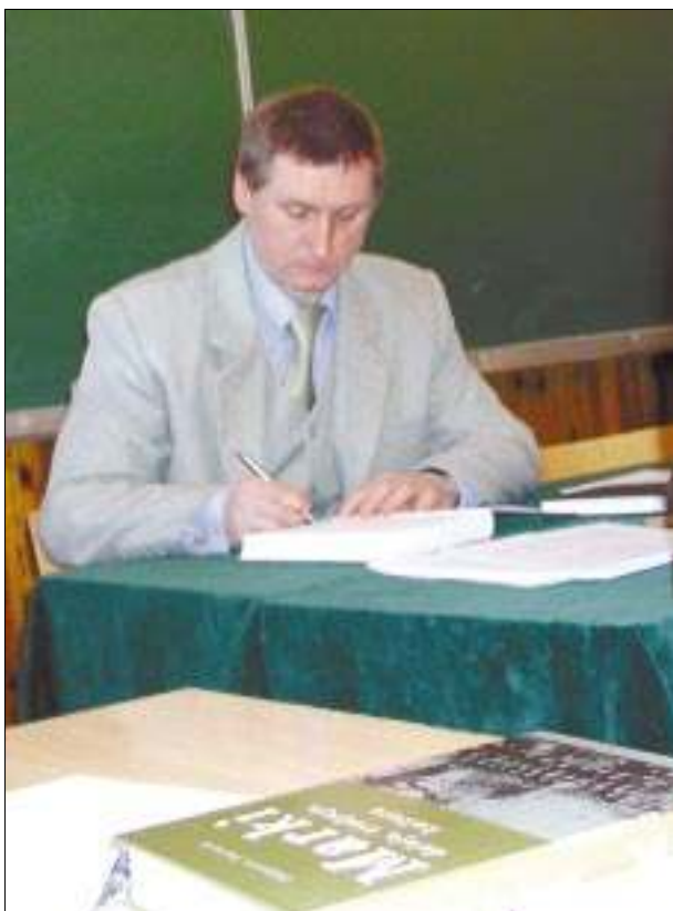
Autor książki „Marki - dzieje, tradycja, kultura” złożył podczas spotkania 19 marca kilkadziesiąt autografów.

Spotkanie, połączone ze sprzedażą książki (sprzedano około stu egzemplarzy), odbyło się w gościnnej sali Pałacyku Briggsów, którą udostępnił na tę okazję dyrektor