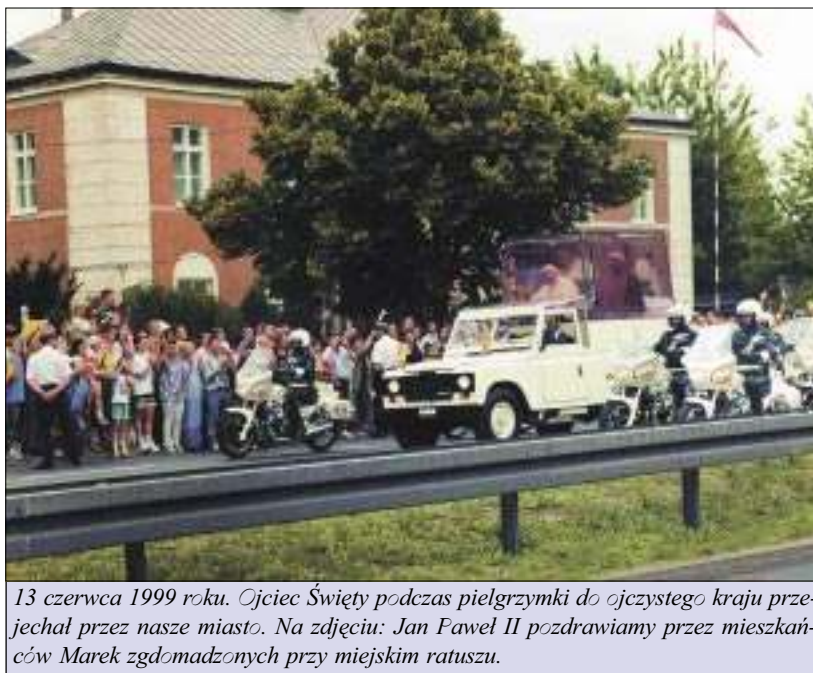
13 czerwca 1999 roku. Ojciec Święty podczas pielgrzymki do ojczystego kraju przejechał przez nasze miasto. Na zdjęciu: Jan Paweł II pozdrawiamy przez mieszkańców Marek zgromadzonych przy miejskim ratuszu.

Trwający czas żałoby jest przede wszystkim czasem wyrażania czci wielkiemu Człowiekowi, Synowi polskiej ziemi, a zarazem – Papieżowi. Jest czasem dziękczynienia za dziedzictwo