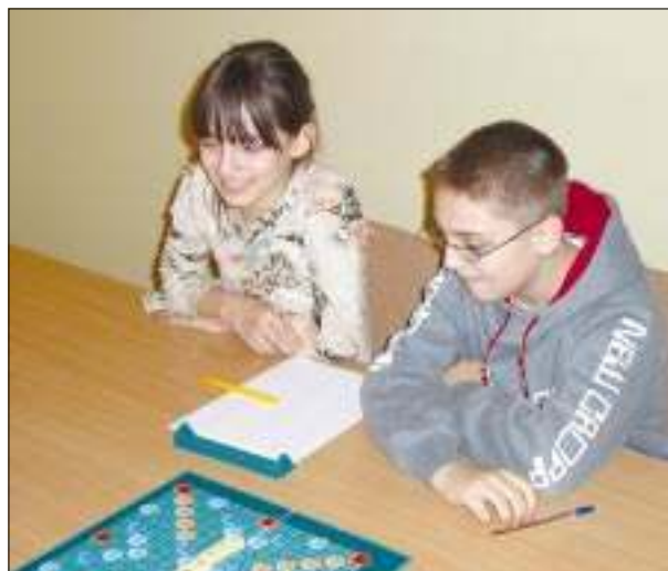
W trakcie zawodów...